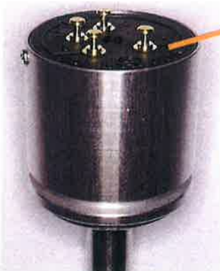
FCPS22AC(CT 付) FCPS22AC(with center tap) ブッシングマウント仕様も同様です。

The position of terminal No. 4 will be changed.